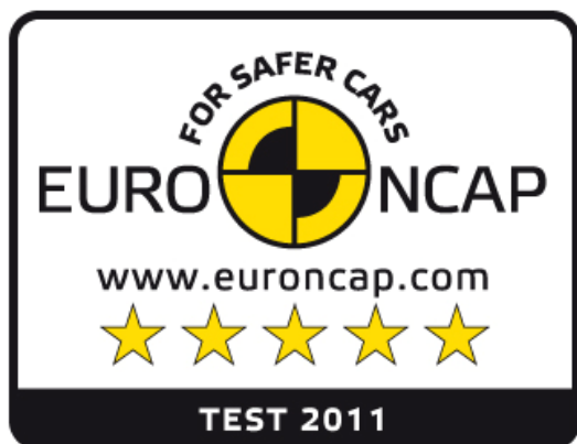
Logo organizace Euro NCAP

Subaru opět zdokonalilo svoji jedinečnou rámovou karoserii s prstencovými výztužemi, kde došlo k optimalizaci přenosu nárazové energie. Nový model XV rovněž využívá ve vyšší míře prvky z vysokopevnostní oceli. Díky provedeným změnám se snížila hmotnost a zároveň zvýšila bezpečnost v případě nárazu ze všech směrů, a tím i zlepšila ochrana cestujících. Ve voze jsou kromě toho zabudovány airbagy v předních sedadlech, u kolene řidiče a po stranách (na ochranu těla i hlavy). Provedená opatření zahrnuje stabilizační systém VDC (zkr. Vehicle Dynamics Control) dodávaný standardně u všech provedení – čímž se z XV stává extrémně bezpečný vůz.